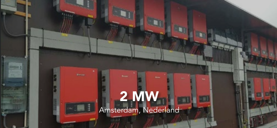
2 MW Amsterdam, Nederland