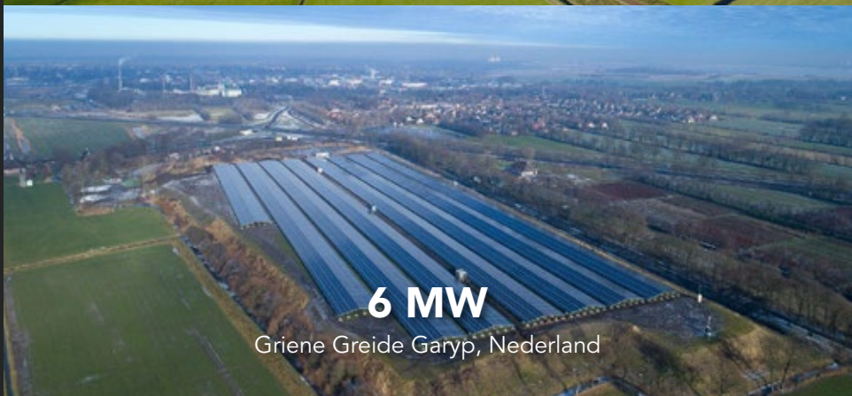
6 MW Griene Greide Garyp, Nederland