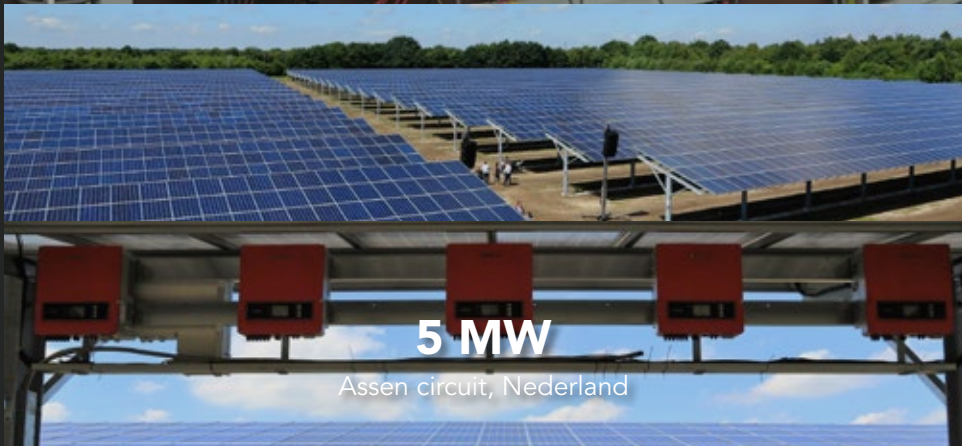
5 MW Assen circuit, Nederland