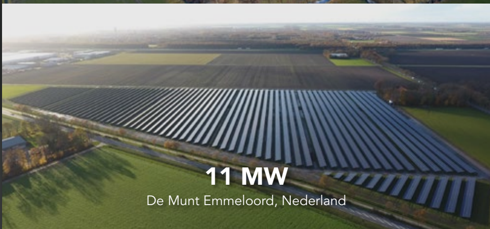
11 MW De Munt Emmeloord, Nederland