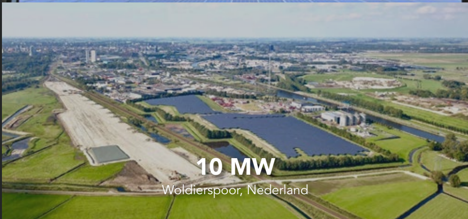
10 MW Woldierspoor, Nederland